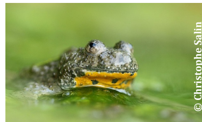
Sonneur à ventre jaune