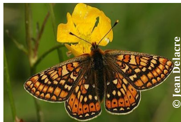
Le damier de la succise