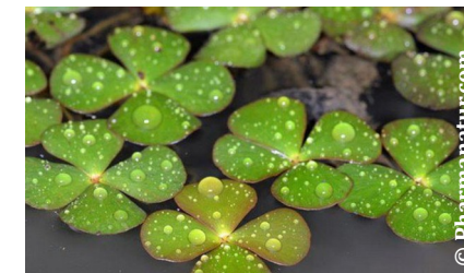
Marsilée à quatre feuilles