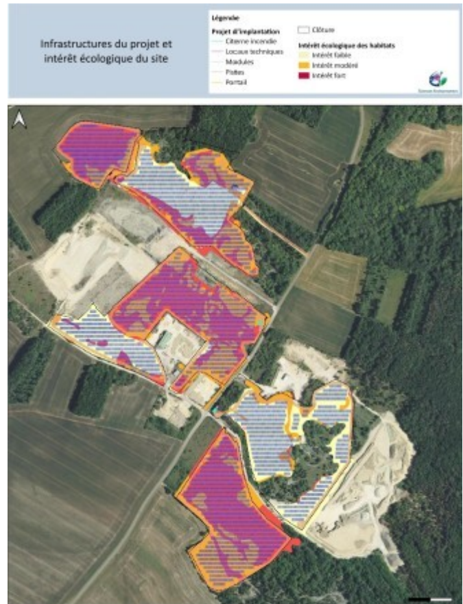
Hiérarchisation des enjeux écologiques dans la ZIP et superposition avec le projet (p.90 et p150 de l'étude d'impact)