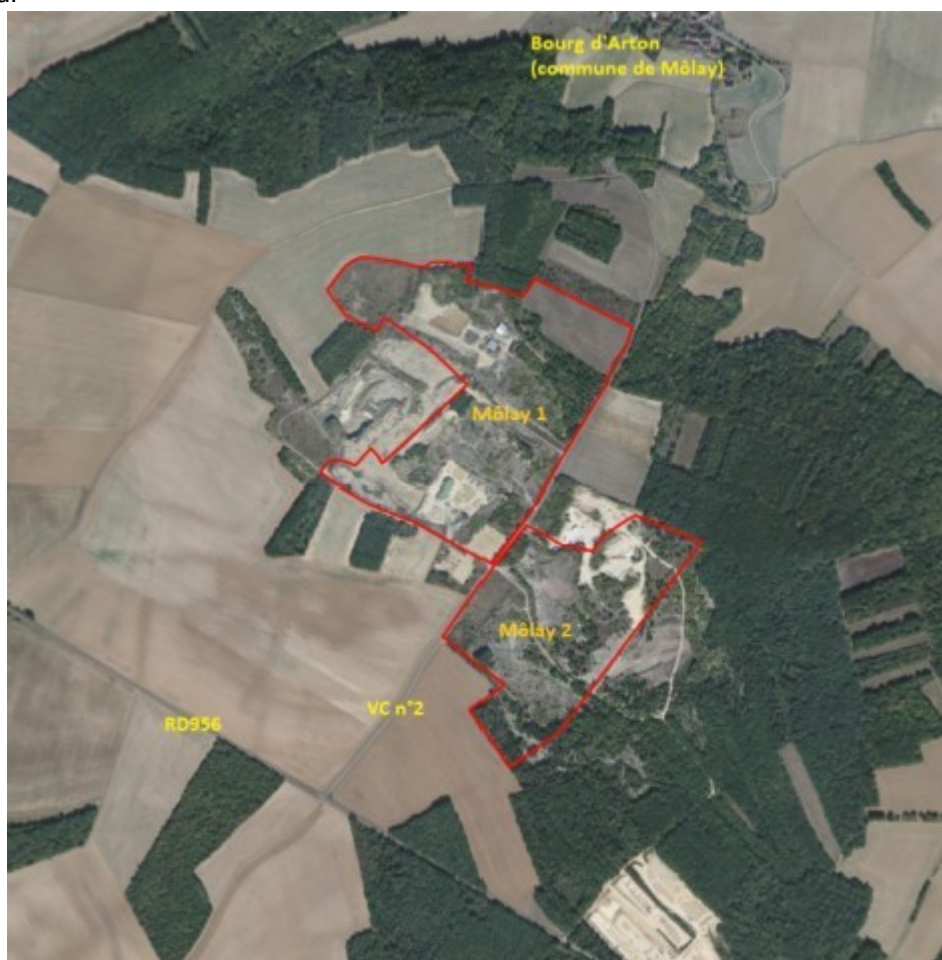
Photographie aérienne de la zone d'implantation potentielle (cf. p.41 de l'étude d'impact)

Le projet se situe sur le rebord d'un plateau légèrement ondulé entaillé par la vallée du Serein à 1,1 km au nord. Le site, anciennement exploité comme carrière de calcaire, est constitué, d'une part, de terrains remis en état et occupés par des friches de recolonisation (pelouses, fruticées, jeunes bois), et, d'autre part, par des zones non réhabilitées occupées par des remblais, d'anciens bâtiments d'exploitation ou utilisées pour diverses activités (plateforme de transit de produits minéraux, stockage de déchets inertes). Il est bordé par une mosaïque de cultures céréalières (principalement à l'ouest) et de boisements feuillus (principalement à l'est). Des zones de carrière toujours en exploitation délimitent le projet sur sa partie est. L'aire d'étude ne comporte aucun cours d'eau, ni zone humide et se situe en dehors de la zone inondable du PPRI 7 du Serein. Les habitations les plus proches se situent en contrebas du plateau au niveau du bourg d'Arton à environ 500 m au nord.