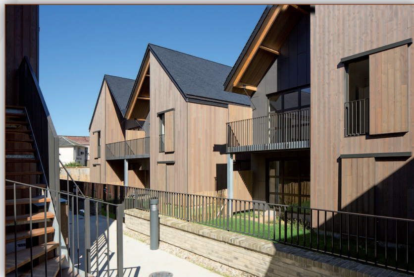
© Vue aérienne : Google Maps, photos Bettinger-Desplanques architectes