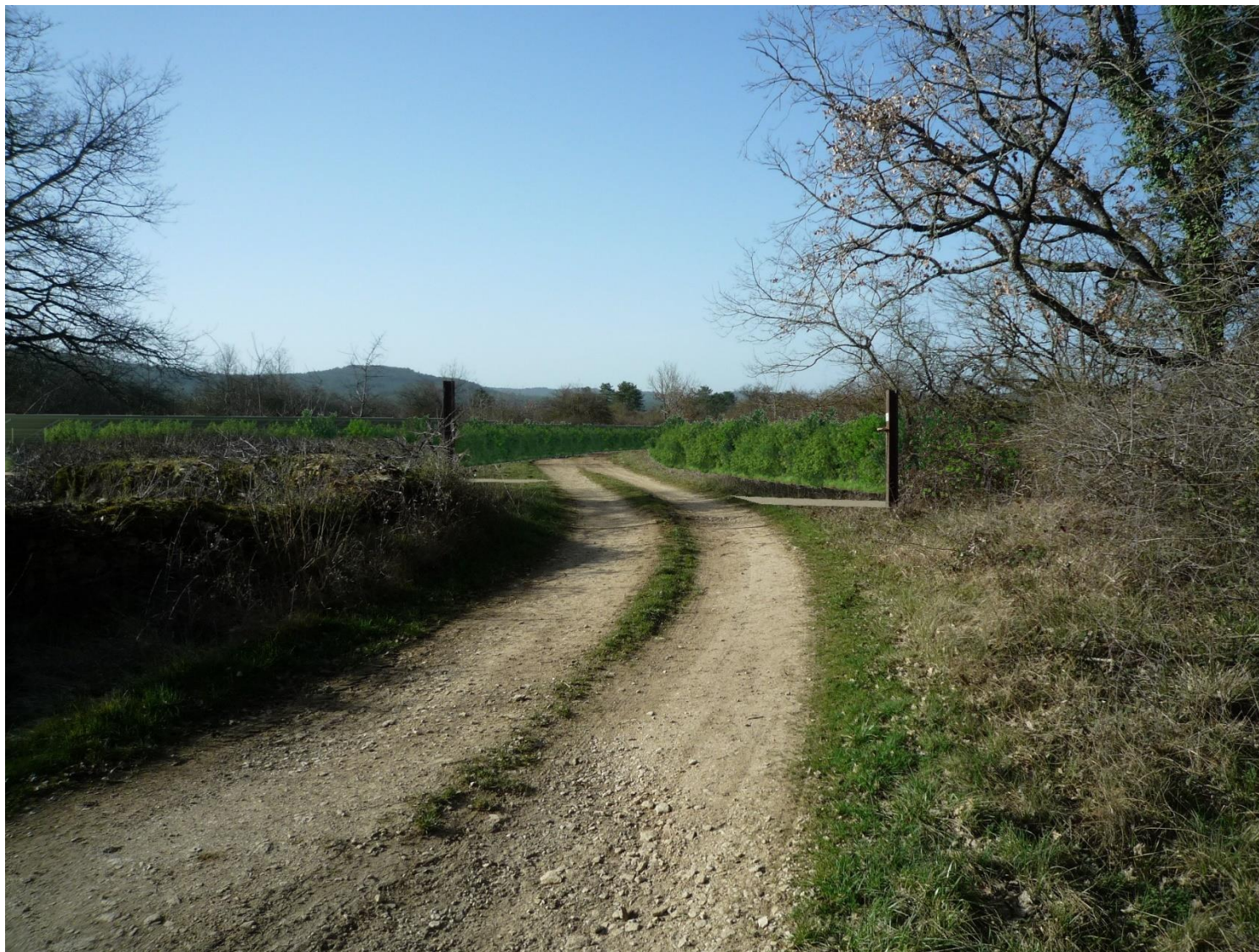
PC 6 – Vault-de-Lugny – "Les Lavières des Jaux" – Insertion du projet de construction dans son environnement