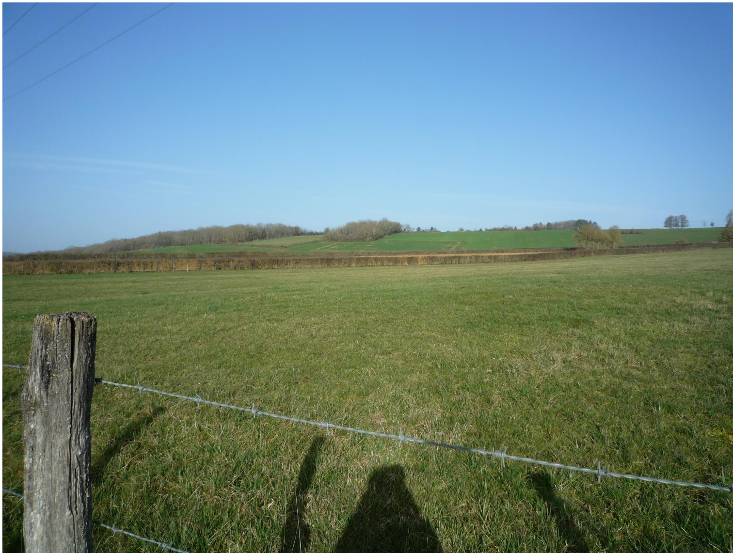
PC 8 – Vault-de-Lugny – "Les Lavières des Jaux" – Photographies permettant de situer le projet dans son environnement lointain

F R E D E R I Q U E L O N C H A M P T A R C H I T E C T E