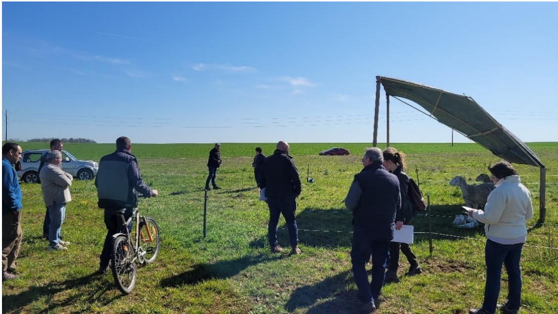
Figure 14 : Discussion en face la structure en bois représentant un panneau photovoltaïque

Pour appuyer la balade, un carnet a été réalisé. Il a été construit autour de trois thématiques :