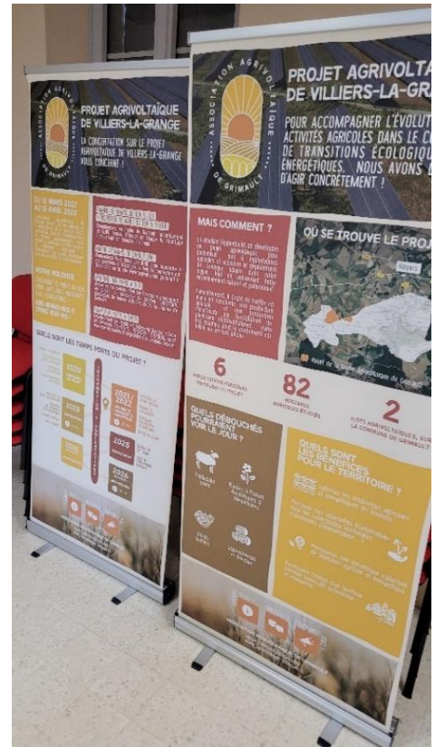
Figure 7 : Kakémonos en place lors des actions de concertation