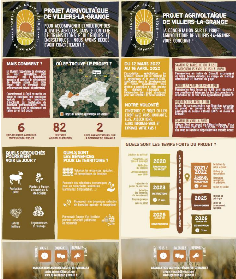
Figure 8 : Kakémonos produits dans le cadre de la démarche

Deux kakémonos ont également été produits. Ils ont été mobilisés à chacune des actions de concertation pour permettre d'informer les participants et les participantes sur le projet et de marquer une présence dans l'espace.