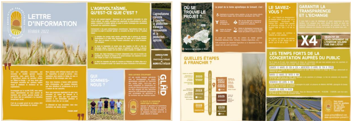
Figure 3 : Lettre d'informations diffusée, format A4 4 pages