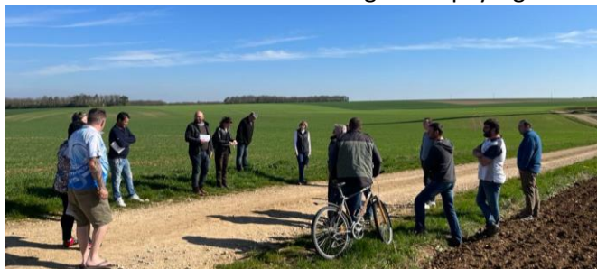
Figure 13 : Pause devant le site d'implantation du projet