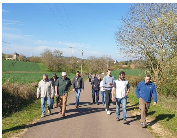
Figure 10 : Balade gourmande du 16 avril 2022

Les actions de concertation se sont donc déroulées entre le 12 mars et le 16 avril 2022. Comme évoqué précédemment des affiches ont été déposées pour informer la population. La maire de Grimault a également informé ces administrés en leur envoyant deux mails, un premier avant les actions pour informer de la tenue de ces rencontres, et un deuxième de 24 mars 2022, pour relancer face à la faible participation sur les premiers évènements de la concertation publique. Les plaquettes déposées dans les boîtes aux lettres ont également informé les habitants de Villiers-la-Grange de la tenue de ces actions.