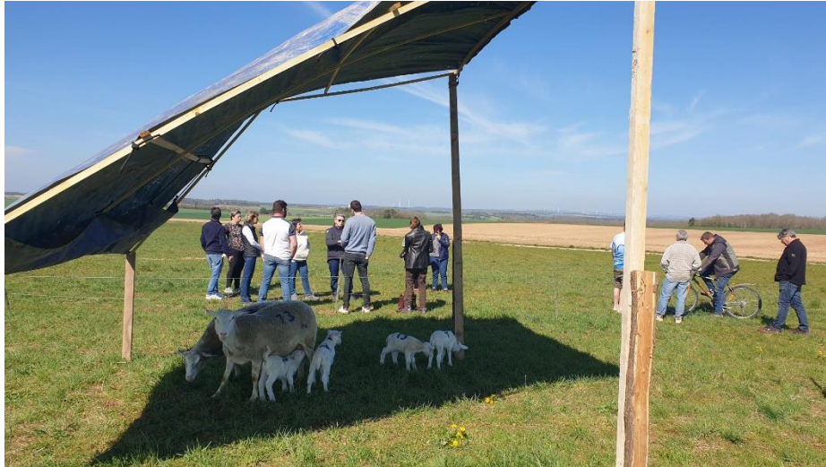
Figure 2 : Balade gourmande du 16 avril