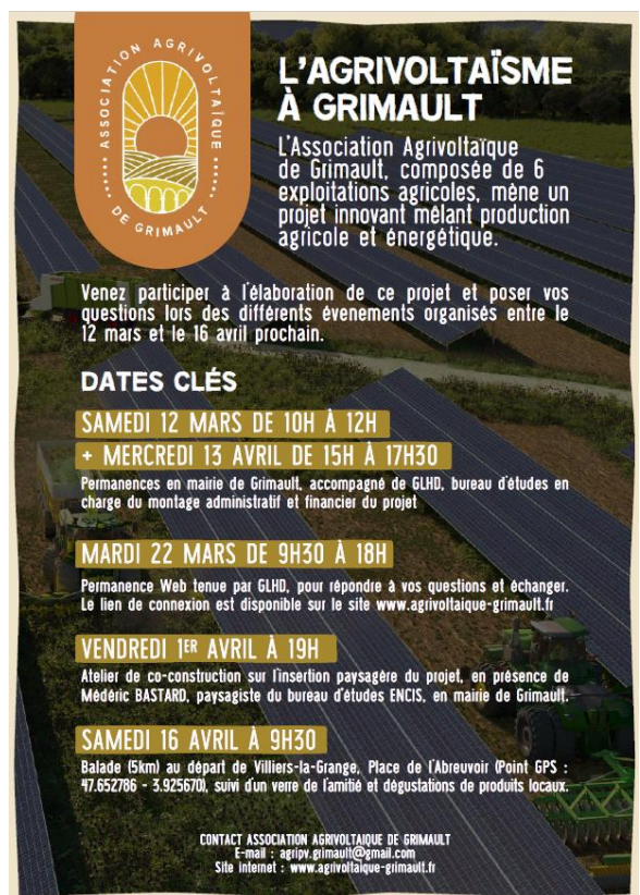
Figure 4 : Affiche diffusée, format A3