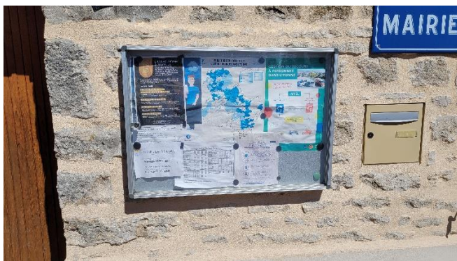
Figure 5 : Affiche présente dans le support d'affichage devant la mairie de Grimault